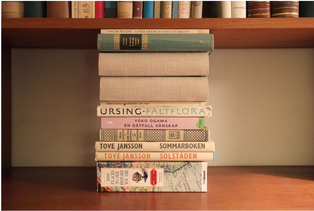
(左上) 作品の画像部分のオリジナル写真 (右上) 積み上げられた老婦人の蔵書のうち、一番上の本の最初の頁と一番下の本の最後の頁の裏に印刷された、作品の随筆部分 (右下) 随筆の英語原文の和訳