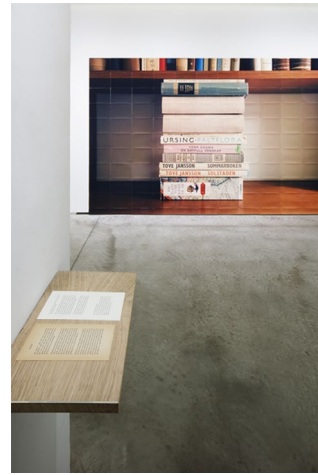
(上) 随筆と画像のインスタレーション風景 (下) 通りがかる観客と画像部分のインスタレーション風景

写真: 218x326 cm (121片), 随筆(紙):各約20x10 cm, 書棚:24x45x1.8 cm