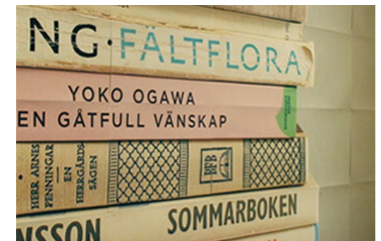
(下) 何枚もの紙片で構成される、画像部分の詳細

画像は、数々の展示を経て酸化、日焼けして「老いて」いくように、長期保存に適さないインクジェット紙にその色彩が長く保たれることのない安価な染料インクで印刷。積み上げられた書籍は、その主題や著者のアイデンティティによって、世界の可動性(移民や観光)、植民・移民の歴史、高齢化社会、LGBT、フェミニズムといった現代社会における多くの人々の関心事につながるものともなっている。