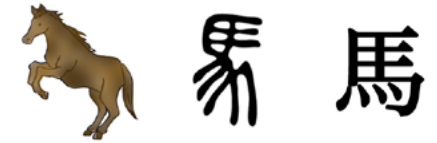
(left page) workshop view at St James Preparatory School (right page, above) before the physical exercise, the artist introduced Chinese characters as pictograph (right page, second) workshop views with a family (right page, third) workshop views with audiences and colleagues (right page, bottom) installation view at Bag Factory

Kulturell appropriering var en återkommande fråga, och dess känslighet skapade utrymme för viktiga diskussioner. För att ifrågasätta konceptet kring kulturellt ägande och arv klargjorde jag under introduktionen att mitt modersmål japanska har lånat kinesiska tecken sedan 400-talet, och idén till den fysiska övningen härstammar från Kontaktimprovisation, en dans utvecklad i New York sedan tidigt 70-tal inspirerad av Aikido, en modern japansk kampsport.