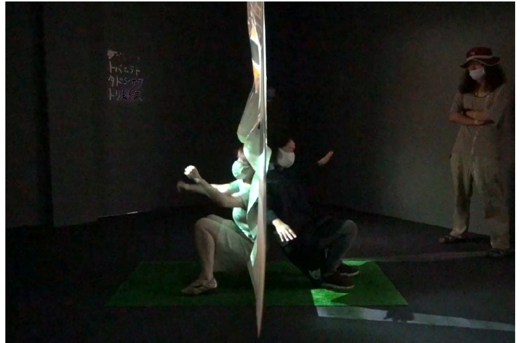
Installation views of Graphic Movements at TOKAS Hongo, Tokyo (2020) A group show during the COVID pandemic. The surface for the video projection divided the space into two. The installation served as the backdrop for another workshop.