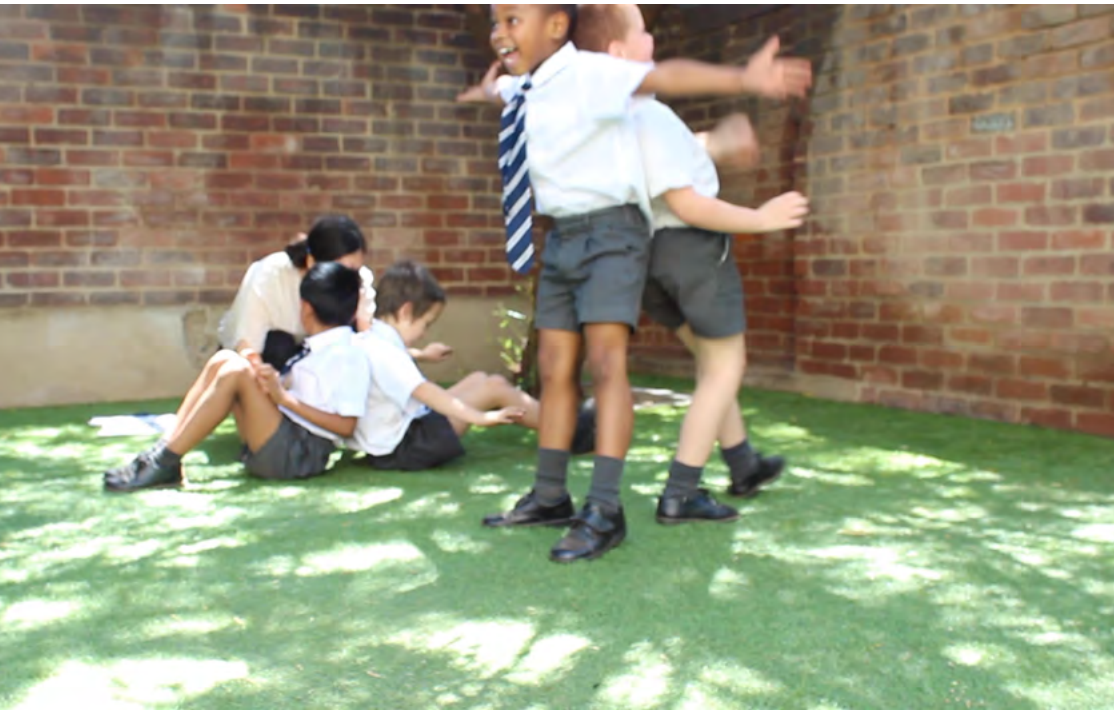
video footage of the workshops in South Africa and Japan (excerpts, 5min): https://youtu.be/6m9mNx7BpN4

Den afrikanska filosofin Ubuntu och den japanska förståelsen av tecknet för person: dessa avlägsna kulturer delar båda idén om att det är samhället som ger en människa hennes medmännisklighet. Tänk om man skulle förkroppsliga tanken på att utöva vår medmännisklighet? En enkel parövning där man sätter sig ner och ställer sig upp genom att luta sig mot varandra. Det uppstod svårigheter, nya tolkningar och stunder av känslomässig interaktion mellan de som var närvarande.