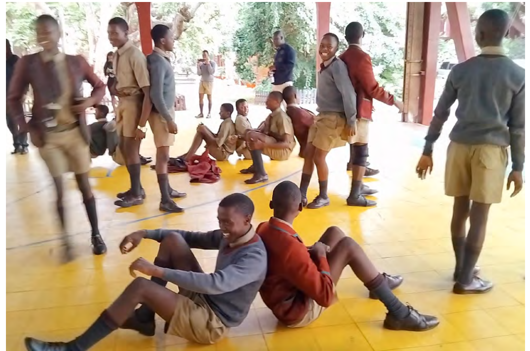
workshop views of Graphic Movements workshop self-initiated by the public at NKF in Stockholm (top left) workshops at National Gallery of Zimbabwe, with the staff (right) with public (bottom left) a workshop at Prince Edward School in Harare