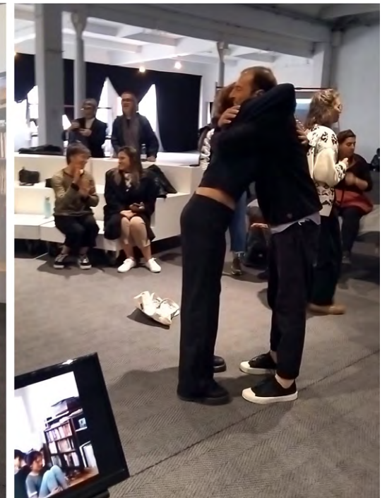
Workshop variations of Graphic Movements try-outs with multiple people at Teikyo University (top) and alone at TOKAS Hongo, Tokyo (left bottom); post-exercise hugs were organically generated at Cittadellarte, Italy (right bottom)