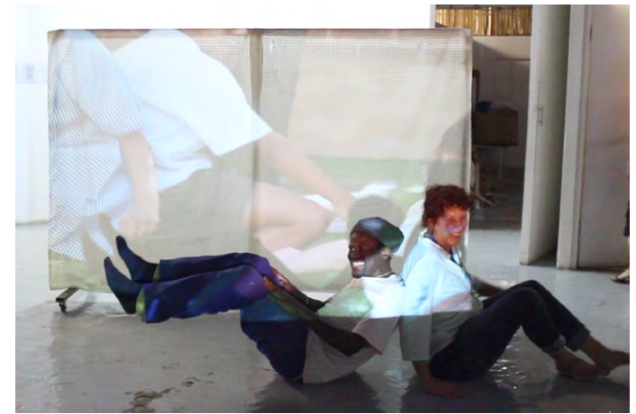
Graphic Movements (2019) An attempt to embody the African philosophy of Ubuntu & the Japanese (mis-)interpretation of Chinese pictograph of “person/human” through a physical exercise in pairs.